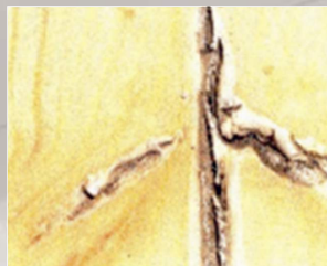
Madera de pino tratada con smalto 328 (foto superior) y con un normal esmalte poliuretánico (foto inferior), expuestas en el techo del politécnico de Torino con un envejecimiento de 5 años. La muestra con el tratamiento al aceite no a sufrido rotura alguna y a permanecido perfectamente adherente al soporte.